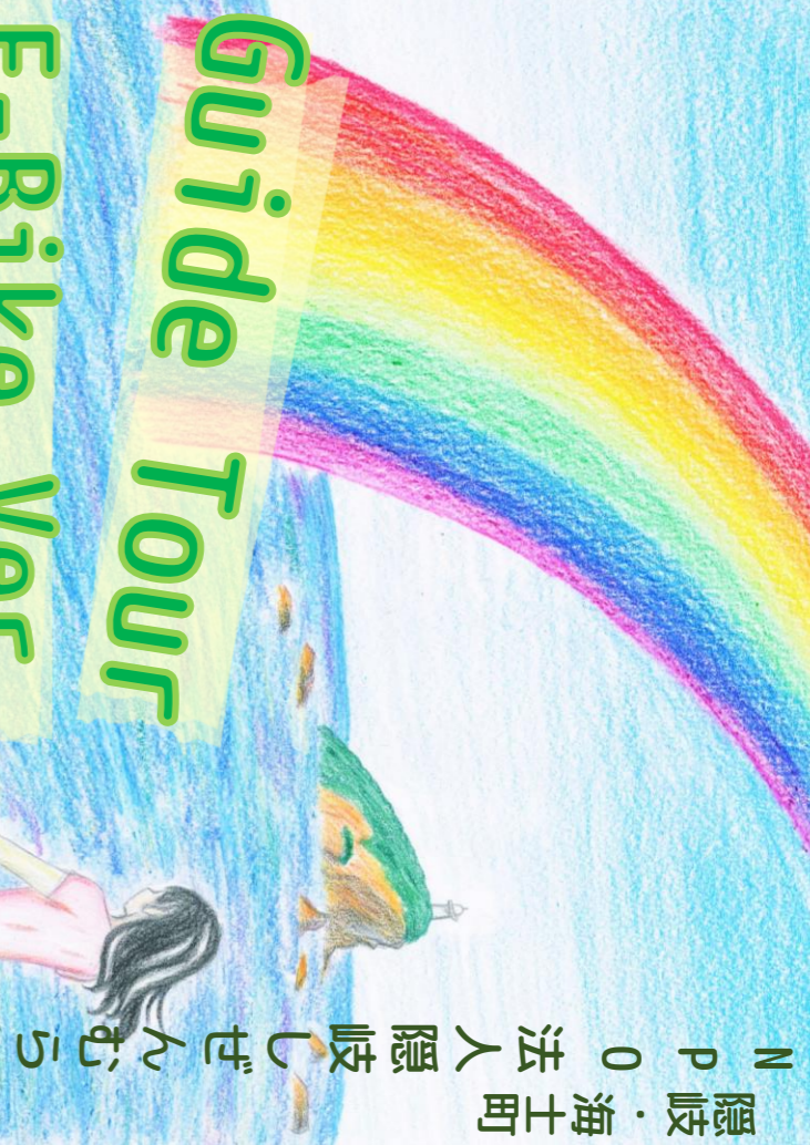
大山隠岐国立公園 隠岐ユネスコ世界ジオパーク